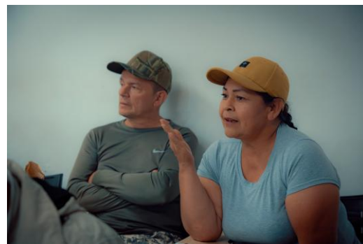
Espacio de diálogo comunidad Marmato caldas