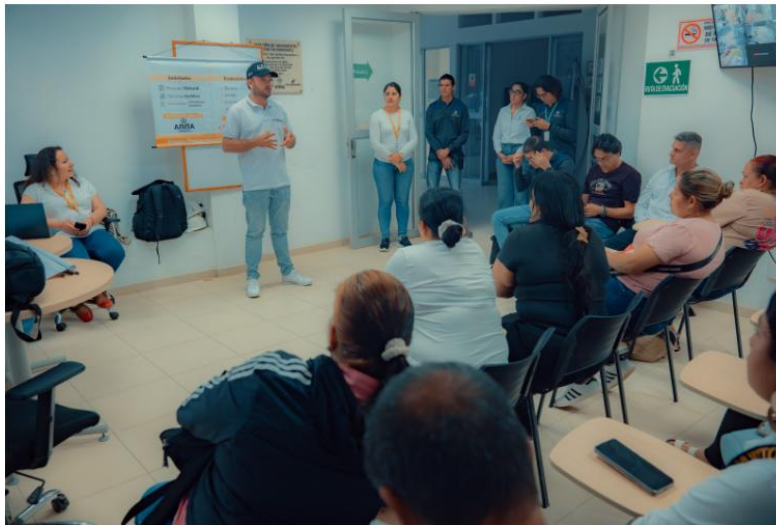
Espacio de diálogo ANM, comunidad y alcalde de Marmato caldas

autoridad minera. En el espacio la comunidad participante manifestó la importancia que tiene este proceso que avanza la ANM para la titulación minera donde se reconozcan las principales preocupaciones de las comunidades, dentro de la cuales se plantearon: la importancia del fortalecimiento y el apoyo a la economía agrícola, el cuidado por las fuentes hídricas puesto que en la zona norte del municipio cuentan con nacederos de agua los cuales son importantes para Marmato, a su vez plantearon preocupación por la niñez y las juventudes e hicieron un llamado para que dentro del ejercicio de responsabilidad social los posibles titulares apoyen con el fomento de otras formas de vida especialmente para esta población dentro de este ciclo de vida y fomenten el deporte, la actividad agrícola y la importancia del estudio.