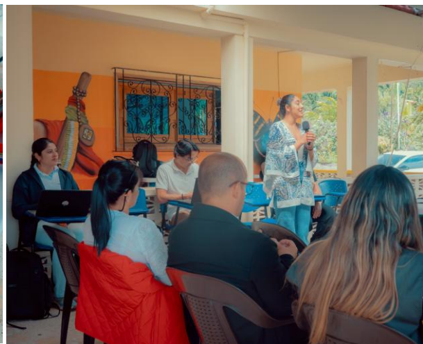
Diálogo y análisis sobre procedimiento de otorgamiento de títulos mineros en territorios indígenas

Análisis procedimientos de otorgamiento de títulos mineros en territorios indígenas.