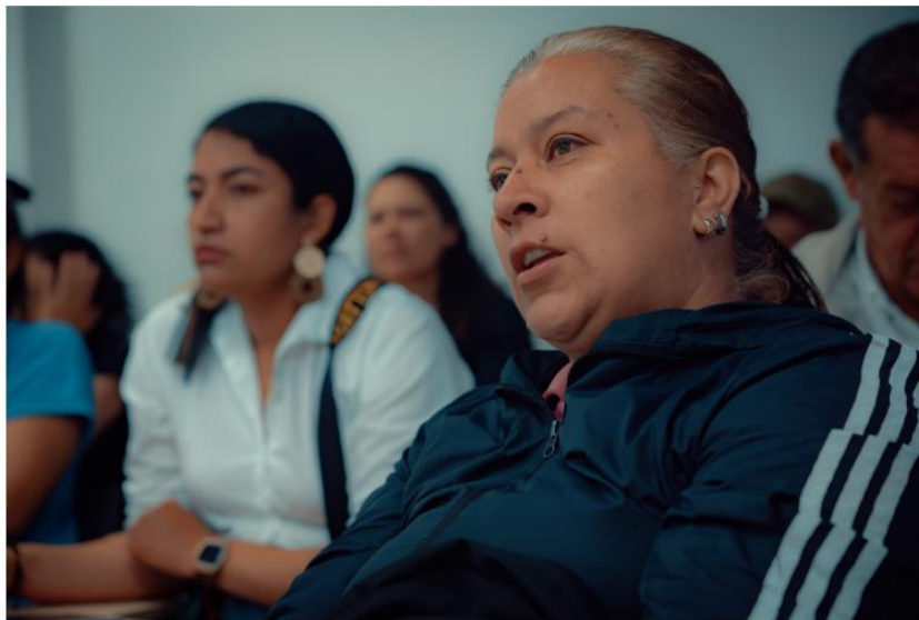
Espacio de diálogo comunidad Marmato caldas

El 19 de noviembre en horas de la tarde el equipo en conjunto con el alcalde de Marmato caldas se dirigieron al punto de Salvamento Minero con el fin de poder avanzar en dos espacios de diálogo necesarios, el primero con comunidad campesina representante de las diferentes veredas de Marmato para dar a conocer las razones de la suspensión y dialogar sobre el panorama para avanzar en la reanudación de la audiencia pública minera, en este espacio la comunidad estaba muy clara sobre la fecha de suspensión y la cantidad de solicitudes mineras que se llevarían a la audiencia. Dentro del ejercicio se realizó mesa de trabajo APM con el ánimo de dar a conocer sobre los diferentes espacios de la audiencia, especialmente los dos escenarios amplios de participación donde se explicó que de vida voz las personas podrían pasar enfrente de la audiencia para dar a conocer su postura y se dejó en evidencia que este es el espacio para dejar clara la postura de la comunidad, el otro momento se mencionó son las mesas de diálogo para la construcción de acuerdos, donde además se dejó claridad que en el marco de la implementación del procedimiento de Audiencias Públicas Mineras, todo lo que se acuerde dentro de la audiencia será incluida en la minuta del contrato del título minero y que por ende será objeto de seguimiento de parte de la