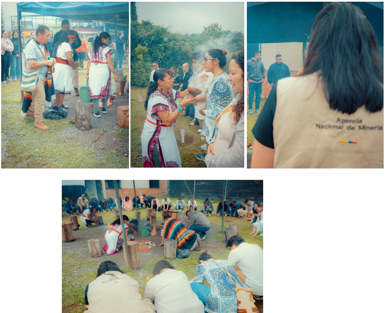
Apertura y ritual de armonización - CRIDEC