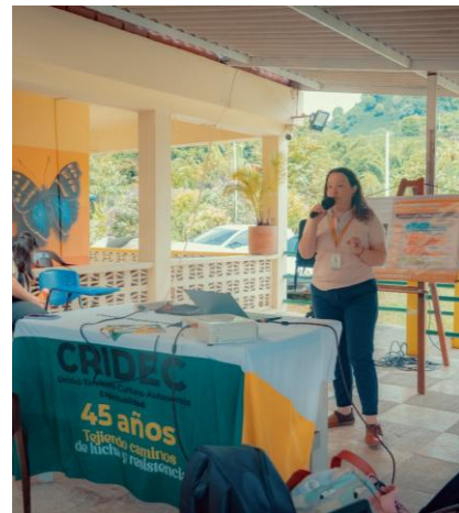
Intervenciones CRIDEC sobre presentación Procedimiento de Audiencias Públicas Mineras